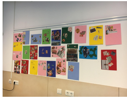
Collages van de eerste kennismakingsles