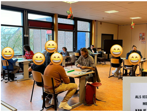
Hard aan het werk op dinsdagochtend!