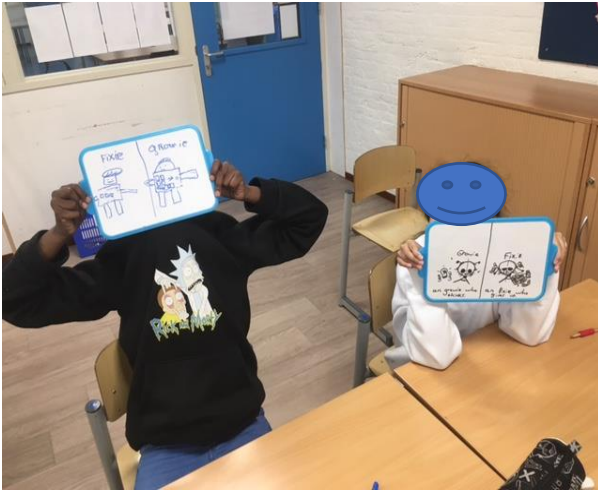
Zelfgemaakte Growies op de Brink.