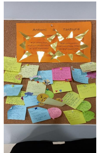
Het Shout-Out bord op de Achtsprong