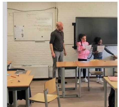
Presentatie van de themavraag op de Brink