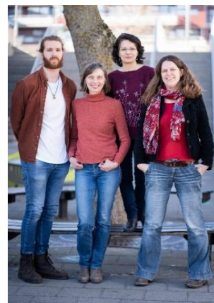
Team Haarlem PO+

Het is bijna Pasen. Wie Pasen zegt, zegt eieren. Weet jij het raadsel op te lossen en dus hoeveel eieren er over zijn?