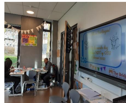
De kennismakingsdagen waren een succes!